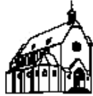
(D) Hl. Drei K6nige Hebborn