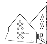
(E) St. Engelbert Rommerscheid